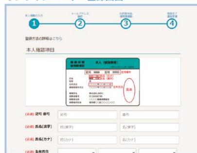
オンラインユーザー登録画面

URL https://pepup.life/users/ekyc/OPLjqjHD/sign_up